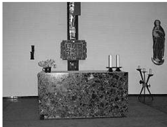
St. Ansgar, Meldorf