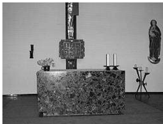
St. Ansgar, Meldorf