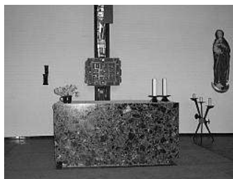
St. Ansgar, Meldorf