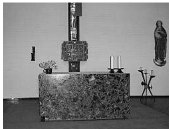
St. Ansgar, Meldorf