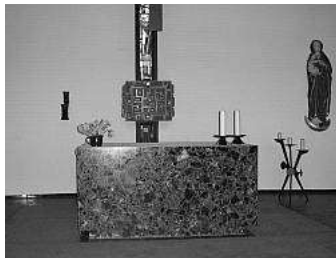
St. Ansgar, Meldorf