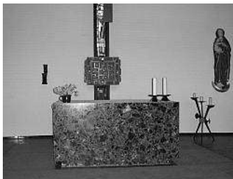
St. Ansgar, Meldorf