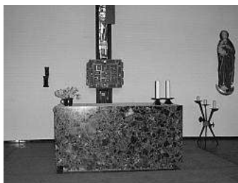
St. Ansgar, Meldorf