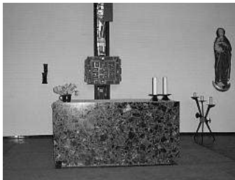
St. Ansgar, Meldorf