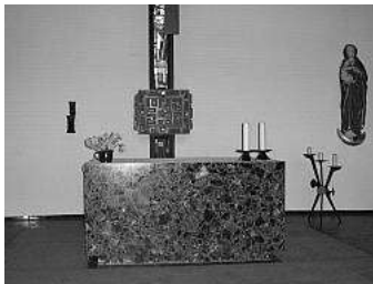
St. Ansgar, Meldorf