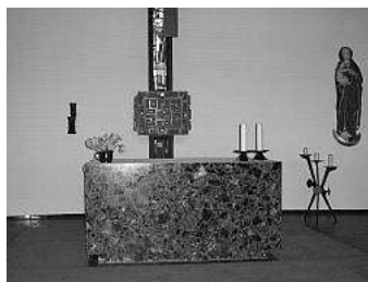
St. Ansgar, Meldorf