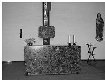
St. Ansgar, Meldorf