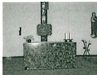
St. Ansgar, Meldorf