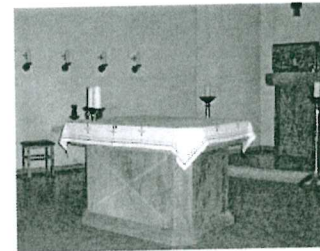
St. Andreas, Büsum