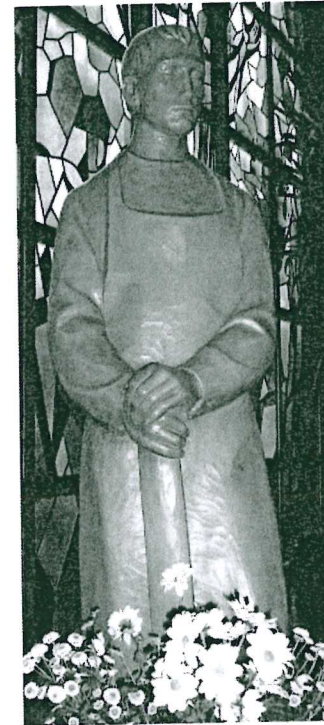
St. Josef, Heide

Seniorenachmittag: An jedem 2. Mittwoch im Monat um 15:00 Uhr in Heide