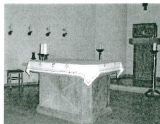
St. Andreas, Büsum