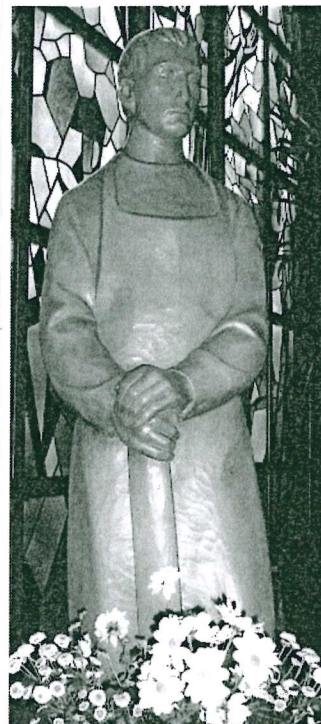
St. Josef, Heide

Herausgeber: Katholisches Pfarramt St. Josef – Kleine Straße 8, 25746 Heide St. Ansgar – Weidendammweg 1, 25704 Meldorf St. Andreas – An der Mühle 60, 25761 Büsum Tel.: 04 81 / 6 25 40 – Fax: 04 81 / 6 83 59 18 E-Mail: pfarrbuero@st-josef-heide.de – Homepage: www.st-josef-heide.de Bürozeiten: Dienstag, Donnerstag, Freitag von 10:00 bis 12:00 Uhr IBAN: DE17 2225 0020 0083 0000 58, SWIFT-BIC: NOLADE21WHO, Sparkasse Westholstein Redaktion: Pfarrbüro, Herrmann Paulisch, Sebastian Gansel Erscheinungsweise: wöchentlich – Auflage: 125 Exemplare