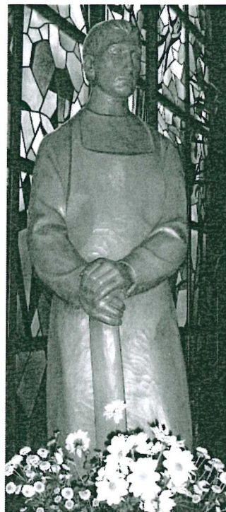
St. Josef, Heide

Seniorenachmittag: An jedem 2. Mittwoch im Monat um 15:00 Uhr in Heide