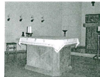
St. Andreas, Büsum