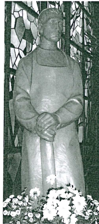
St. Josef, Heide

Seniorenachmittag: An jedem 2. Mittwoch im Monat um 15:00 Uhr in Heide