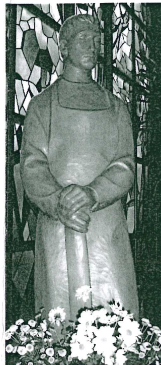
St. Josef, Heide

Seniorenachmittag: An jedem 2. Mittwoch im Monat um 15:00 Uhr in Heide