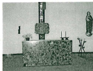
St. Ansgar, Meldorf