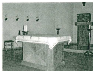
St. Andreas, Büsum