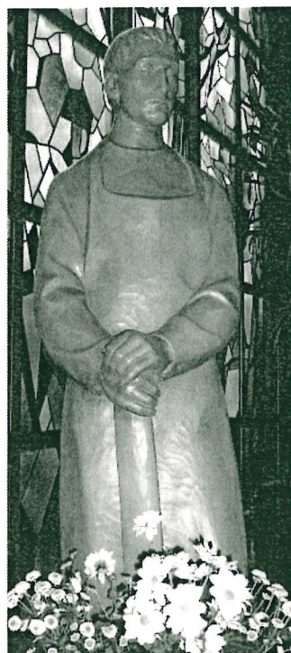
St. Josef, Heide

Seniorenachmittag: An jedem 2. Mittwoch im Monat um 15:00 Uhr in Heide