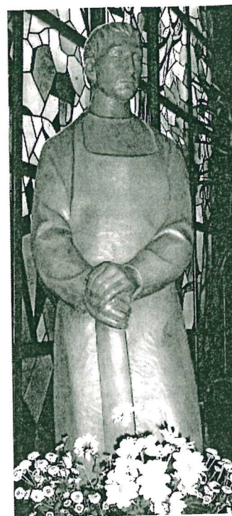
St. Josef, Heide

Seniorenachmittag: An jedem 2. Mittwoch im Monat um 15:00 Uhr in Heide