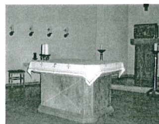
St. Andreas, Büsum