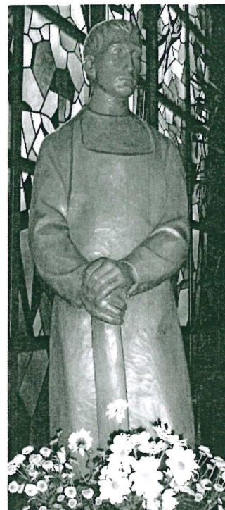
St. Josef, Heide

Seniorenachmittag: An jedem 2. Mittwoch im Monat um 15:00 Uhr in Heide