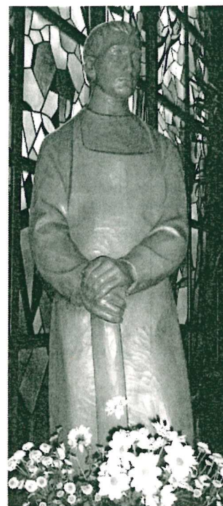
St. Josef, Heide

Seniorenachmittag: An jedem 2. Mittwoch im Monat um 15:00 Uhr in Heide