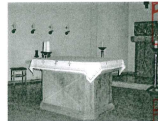
St. Andreas, Büsum