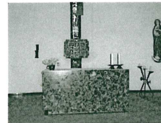
St. Ansgar, Meldorf