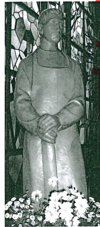
St. Josef, Heide

Seniorenachmittag: An jedem 2. Mittwoch im Monat um 15:00 Uhr in Heide