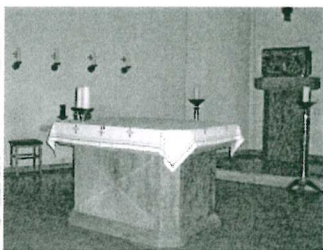
St. Andreas, Büsum