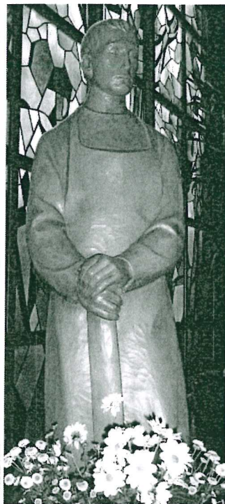
St. Josef, Heide

Seniorenachmittag: An jedem 2. Mittwoch im Monat um 15:00 Uhr in Heide