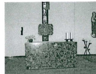
St. Ansgar, Meldorf