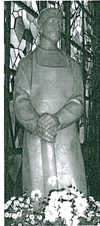
St. Josef, Heide

Seniorennachmittag: An jedem 2. Mittwoch im Monat um 15:00 Uhr in Heide