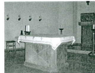
St. Andreas, Büsum