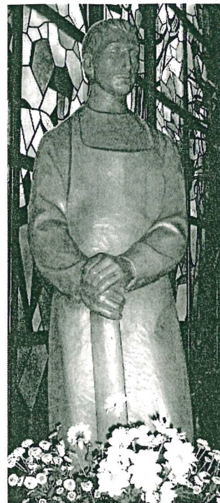
St. Josef, Heide

Seniorenachmittag: An jedem 2. Mittwoch im Monat um 15:00 Uhr in Heide