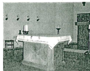
St. Andreas, Büsum