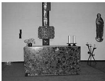
St. Ansgar, Meldorf