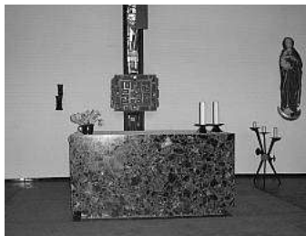
St. Ansgar, Meldorf