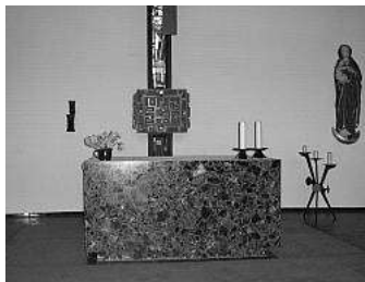
St. Ansgar, Meldorf