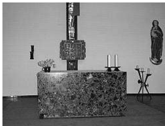
St. Ansgar, Meldorf