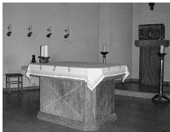
St. Andreas, Büsum