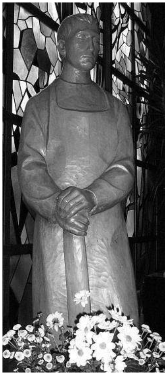
St. Josef, Heide