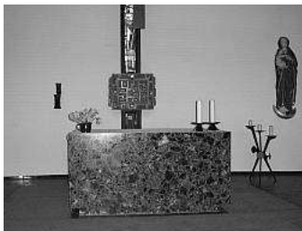
St. Ansgar, Meldorf