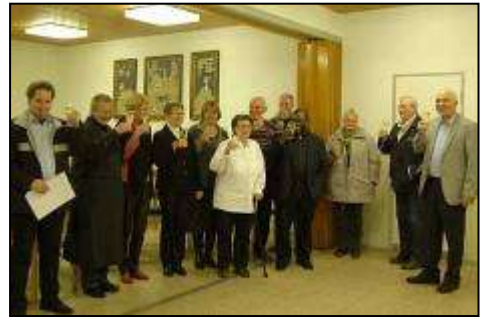
Nach Bekanntgabe des Ergebnisses wird gemeinsam angestoßen

Das gute Miteinander und die zügige disziplinierte Arbeit machten es möglich, dass die Wahlkommission und der Wahlvorstand allen vorgegebenen Fristen gerecht werden konnte und es zu einem guten und ungestörten Ablauf der Wahlen kam.