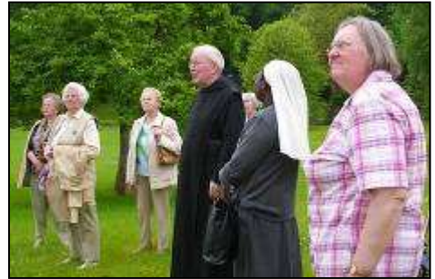
Im Kloster Nütschau

Der April brachte uns gesellige Nachmittage, die dann aber im Mai durch die Maiandacht etwas später begannen.