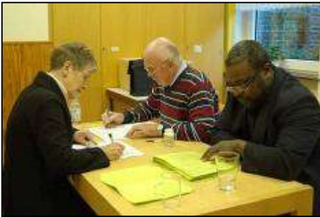
Die letzten Stimmen werden ausgezählt

Die diesjährigen Wahlen des Kirchenvorstandes und des Pfarrgemeinderates wurden geleitet durch einen gut strukturierten Terminplan, der vom Erzbistum Hamburg vorgegeben wurde. Dies hatte zur Folge, dass die Wahlkommission bereits Mitte August tätig werden musste, um die Wahlen am 6. und 7. November fristgerecht durchführen zu können.