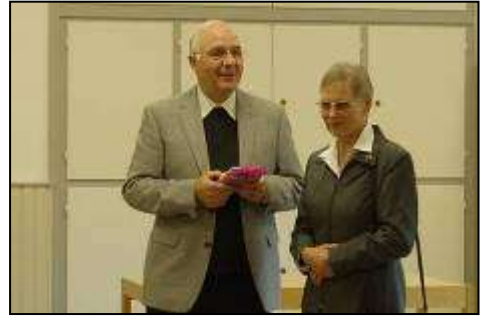
Der Jubilar und seine Ehefrau beim Empfang im Pfarrsaal

In einer beeindruckenden Feier wurden ihm und auch seiner Frau für die Arbeit in und an unserer Pfarrgemeinde gedankt. Pfarrer Agbahey drückte es in seiner Predigt so aus: „Er ist ein Kind dieser Gemeinde (Familie) und so